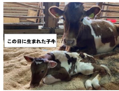
この日に生まれた子牛