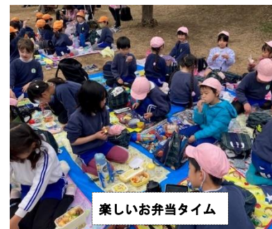
楽しいお弁当タイム