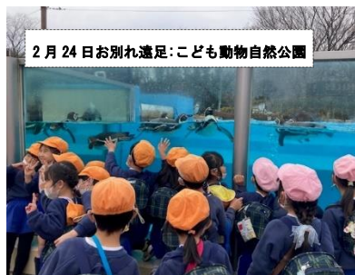
2月24日お別れ遠足:こども動物自然公園

卒園生の保護者の皆様には、今までの園へのご支援ご協力に心より感謝申し上げます。お子様の小学校でのさらなるご活躍を応援いたしております。