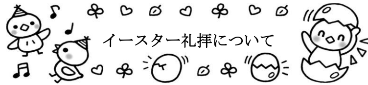
イースター礼拝について

イースターは「復活祭」です。イエス様の復活を祝い、重要な日なのです。幼稚園ではイースターカードを作って合同礼拝を行います。また、卵は昔からお祭りにふさわしいごちそうだともいわれています。