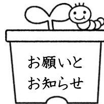
お願いと お知らせ

イースターは「復活祭」です。イエス様の復活を祝い、重要な日なのです。幼稚園ではイースターカードを作って合同礼拝を行います。また、卵は昔からお祭りにふさわしいごちそうだともいわれています。