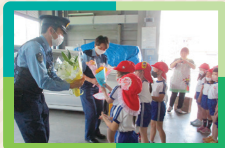
花の日礼拝・訪問