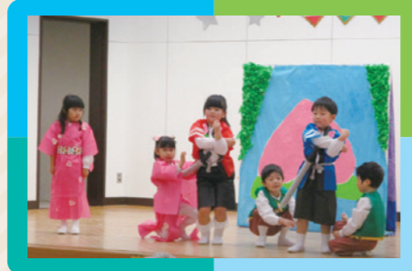
クリスマス生活発表会